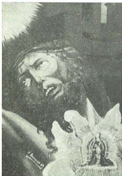
IL FIORE DELLA PASSIONE