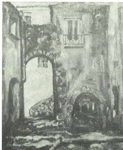
GROTTAMINARDA - VIA TEATRO