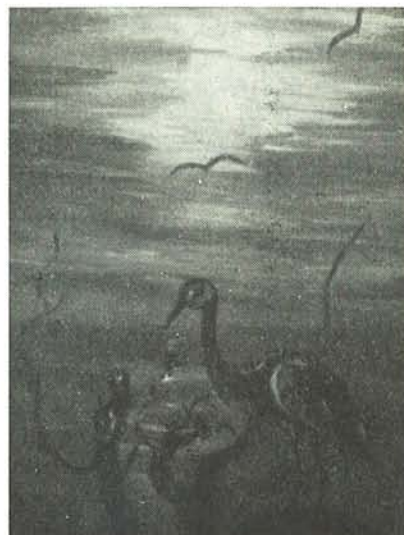
UNO STRANO SOGNO