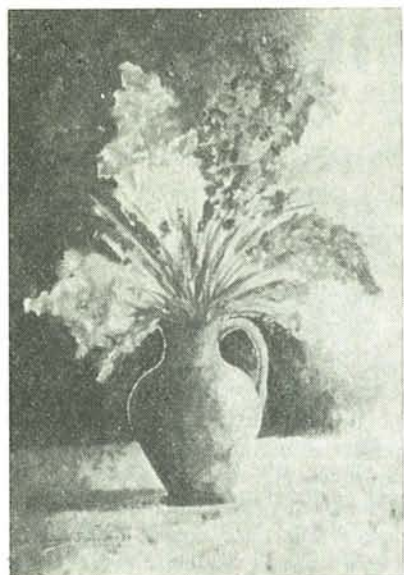
NATURA MORTA CON FIORI