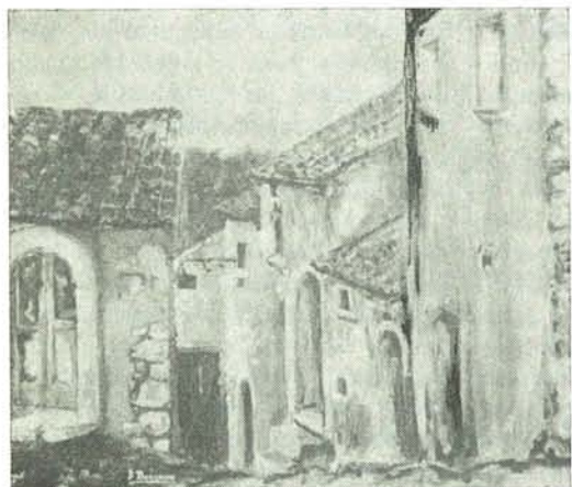
GROTTAMINARDA - PIETRE ANTICHE (Un suggestivo angolo ormai scomparso)