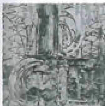
Barrese, River vibrazione di luce , 2012, acrilico su tela 100 x 100 cm