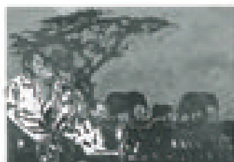
Barrese, Africa , 2013, olio e tecnica mista su tela 70 x 50 cm

tura sono le componenti fondamentali della sua espressione artistica; da qui l'incontro con autori di fama mondiale come Hugo Pratt, Milo Manara, Giorgio Cavazzano e altri. Partecipa all'organizzazione della manifestazione Tiferno Comics, evento che ogni anno assegna l'Oscar del fumetto italiano. Tiene la sua prima esposizione nel 2009 a Doha, nel Qatar, e ottiene importanti riconoscimenti in diversi concorsi e biennali d'arte. Soggetti: legati al mondo musicale, dal Rinascimento al rock e i suoi miti, al jazz e all'anima della città. Tecniche: olio e tecniche miste. Ha scritto dell'artista: Aio, Angelucci, Bellola, Dipol, Galdi, Levi, Modica, Pagliaro, Salvato, Servida, Sotzile, Stefan, Stefani, Vannucci.